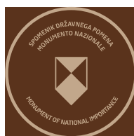
B2.2 Označevalni element B2.2 trojezičen - v bronu (samo v kombinaciji z B1.2)