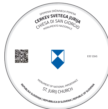
A1 Označevalni element A1 trojezičen s QR kodo