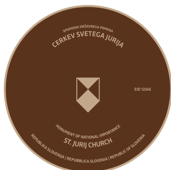
B1 Označevalni element B1 dvojezičen - v bronu