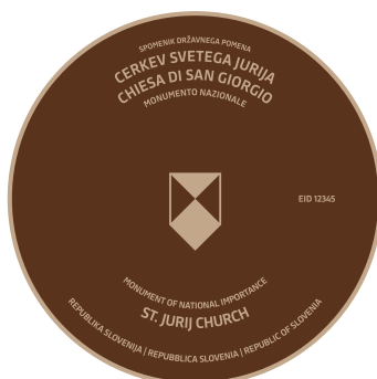
B1 Označevalni element B1 trojezičen - v bronu