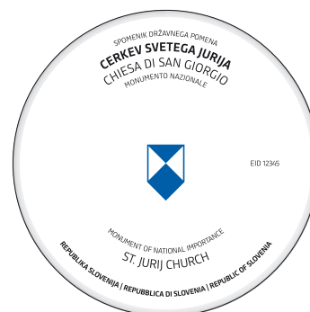
A1 Označevalni element A1 trojezičen