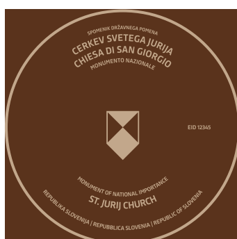
B1.2 Označevalni element B1.2 trojezičen - v bronu