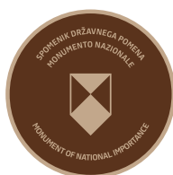
B2 Označevalni element B2 dvojezičen - v bronu (samo v kombinaciji z B1)