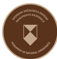
B2 Označevalni element B2 trojezičen - v bronu (samo v kombinaciji z B1)