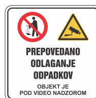
DOT-5.5 400x400 600x600