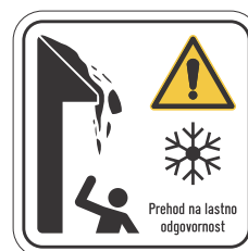
DOT-11 300x300 400x400 600x600