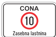
DOT-4.2 400x200 600x400