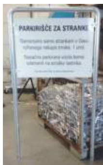
DOT-9.2 800x600 tabla ~1000x1500 okvir