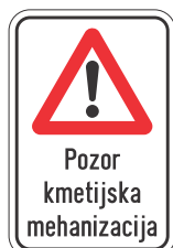
DOT-4.3 200x400 400x600