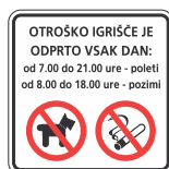
TOI-005 Opozorilna tabla za igrišče 500x500 mm 600x600 mm 700x700 mm