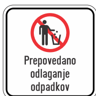
DOT-5.3 400x400 600x600