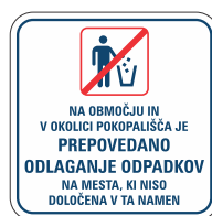
DOT-3.2 400x400 600x600