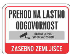
DOT-4.7 400x300 600x450