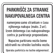
DOT-9.1 400x400 600x600