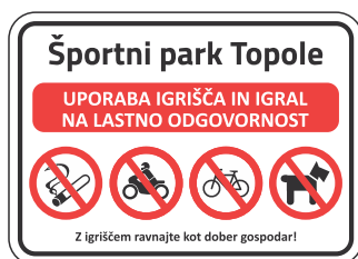
TOI-004 Opozorilna tabla za igrišče 700x500 mm 850x600 mm 1000x700 mm