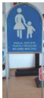
DOT-9.3 družina 530x650 tabla 600x1500 okvir