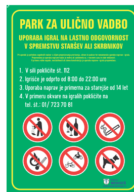
TOI-003 Opozorilna tabla za igrišče 700x1000 mm