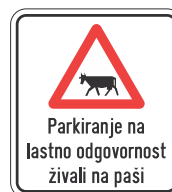
DOT-4.1 400x400 600x600