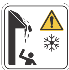
DOT-11 300x300 400x400 600x600