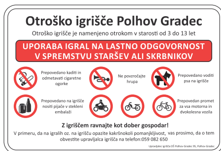
TOI-001 Opozorilna tabla za igrišče 600x900 mm 800x1200 mm 1000x1500 mm