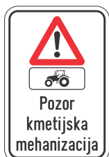
DOT-4.4 200x400 400x600