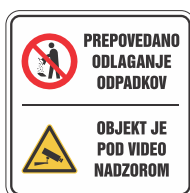
DOT-5.6 400x400 600x600

* Tabli je lahko dodan vaš logotip. Izdelujemo tudi table s poljubnim tekstom in motivom po vaši predlogi.