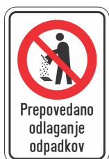
DOT-5.4 200x400 400x600