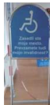
DOT-9.4 invalid 530x650 tabla 600x1500 okvir