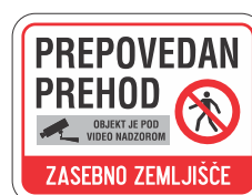
DOT-4.6 400x300 600x450