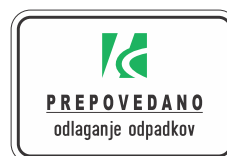
DOT-5.1* 600x300 600x400

DOT-5 Opozorilne table „Prepovedano odlaganje odpadkov“