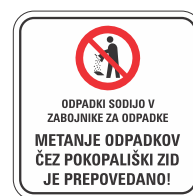
DOT-3.3 400x400 600x600