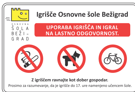
TOI-002 Opozorilna tabla za igrišče 600x900 mm 800x1200 mm 1000x1500 mm