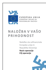
GT-EU4-RR Razlagalna tabla EU 1000x1500 mm