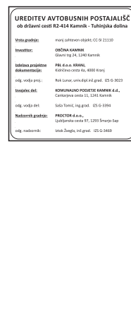
GIT-004 Gradbiščna informacijska tabla 600x600, 750x750 mm