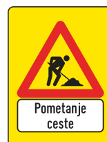
DT-005 Opozorilna tabla - pometanje ceste 400x600 mm 600x900 mm 900x1200 mm