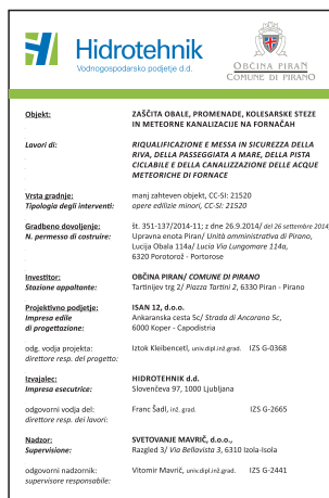
GIT-003 Gradbiščna informacijska tabla - dvojezična 1000x1500 mm