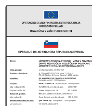
GT-EU1 Gradbiščna tabla EU 2200x2500 mm 1000x1500 mm* *v primeru ko gradbeno dovoljenje ni potrebno