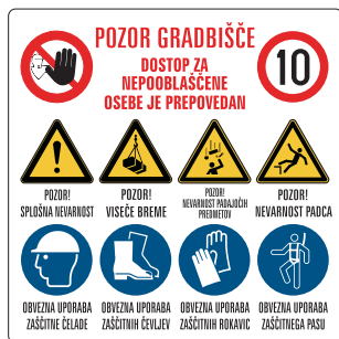
GOT-001 Opozorilna gradbiščna tabla 800x800 mm 1000x1000 mm 1200x1200 mm