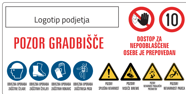
GOT-003 Opozorilna gradbiščna tabla 1000x500 mm 1200x600 mm