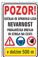
DT-003 Opozorilna tabla - spravilo lesa 400x600 mm 600x900 mm