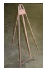
Trižno stojalo za znake/table v = 125 cm Fe-prašno barvano