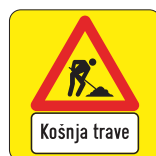
DT-004 Opozorilna tabla - košnja trave 600x600 mm