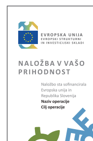
GT-EU4-SI Razlagalna tabla EU 1000x1500 mm