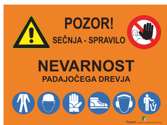
DT-001 Opozorilna deloviščna tabla - spravilo lesa 600x450 mm 800x600 mm 1000x750 mm