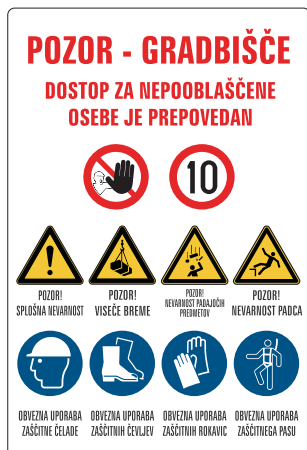
GOT-002 Opozorilna gradbiščna tabla 800x1200 mm 1000x1500 mm