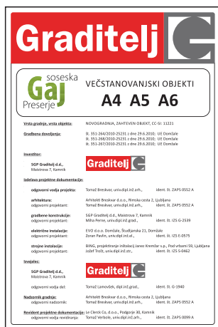
GIT-001 Gradbiščna informacijska tabla (brez roba) 1000x1500 mm

Standardne velikosti tabel (glede na količino teksta): 600x600, 750x750, 1000x1500 mm