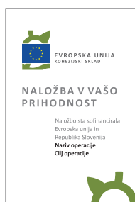
GT-EU4-K Razlagalna tabla EU 1000x1500 mm