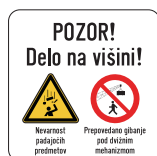
DT-002 Opozorilna deloviščna tabla - delo na višini 600x600 mm